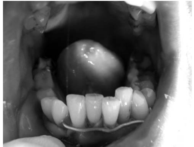
Рис. 2. Післярезекційний протез: конструкція з еластичною підкладкою та багатоланковим вестибулярним кламером; встановлення протеза (вигляд спереду).

Всі ці чинники належать до передопераційної підготовки хворих. Після операції використовували