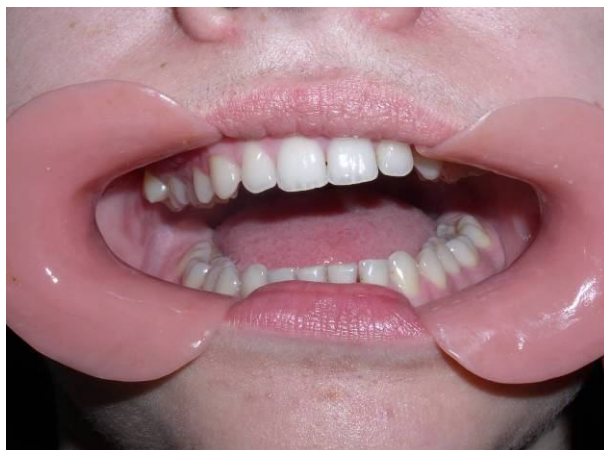
Рис. 3. Перед початком лікування: відкриття рота - 1,5 см

Через 2 тижні відкриття рота складає 3,0 см. Хвора продовжує користуватись апаратом. Стан хворої значно покращився.