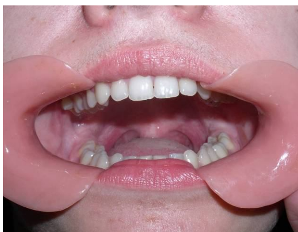
Рис. 4. Через 2 тижні від початку лікування: відкриття рота – 3 см

Використання запропонованого апарата для лікування контрактур нижньої щелепи, який індивідуалізується згідно з клінічними вимогами, гарантує високий лікувальний ефект.