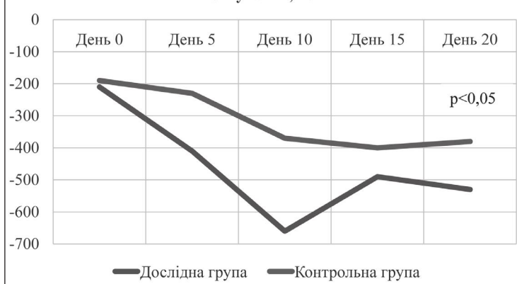
Рисунок 1 – Порівняння динаміки водного балансу між досліджуваними групами в процесі лікування.