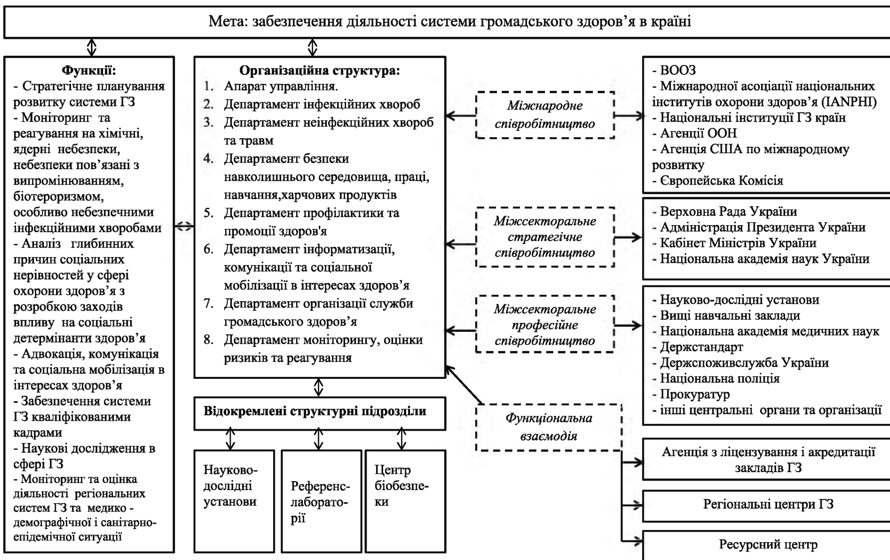
Рис. 1. Функціонально-організаційна модель центру громадського здоров'я МОЗ України.