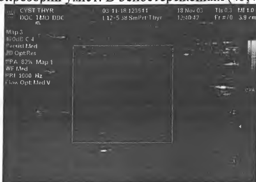
Рис. 3 Ультразвукове зображення кістозного утворення бічної ділянки шиї хворого С., 37 років, історія хвороби № 1052. Діагноз: дермоїдна кіста бічної ділянки шиї справа. Візуалізується гіпоехогенне, гідрофільне утворення, розміром 2,5х3 см, округлої форми з рівними чіткими контурами, оточене стінкою товщиною 3мм.

За умов ультразвукового обстеження пацієнтів з дермоїдними кістами ехоструктура вказувала на гіпоехогенність та гідрофільність, чіткість та рівність контурів. У середині порожнини прослідковувалась наявність рідинної субстанції з дрібнодисперсними включеннями, яка була оточена щільною та потовщеною стінкою до 3мм (рис.3). Результати УЗД кіст слинної залози бічної поверхні шиї вказували на гіпоехогенність та гідрофільність тканин кісти слинної залози, чіткість контурів із товщиною оболонки до 1мм. У середині порожнини визначався ехопрозорий вміст. В спостереженнях (45,4%) вони мали перетинки у вигляді тяжів (рис.4).