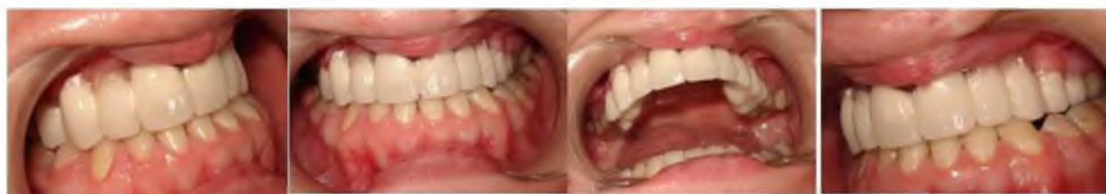
Рис. 4, 5. Клінічний огляд після комплексного лікування.