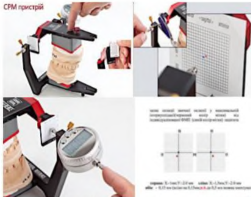
Рис.1 Пристрій А-СРМ для оцінки просторового положення СНЩС пацієнтів