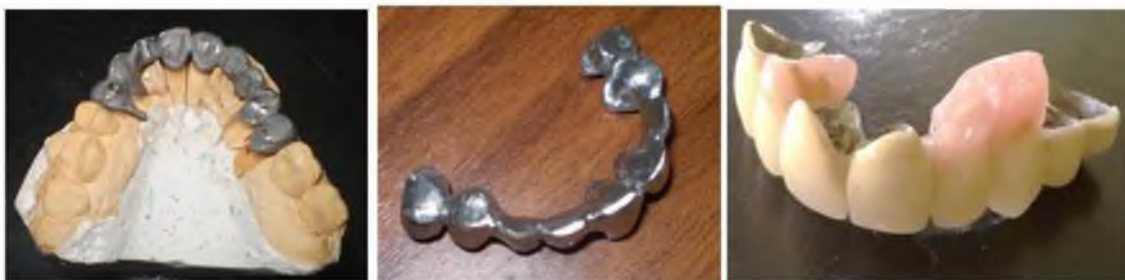
Рис. 3. Металокерамічний протез на верхню щелепу.