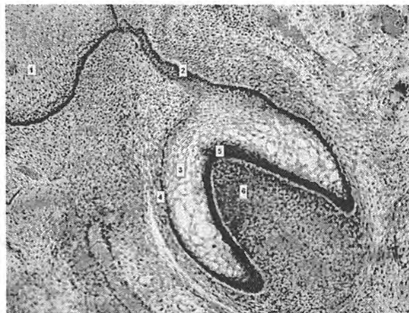
Рис. 1. Утворення зачатка зуба в стадію купола

З метою більш глибокого вивчення процесу диференціювання клітинних елементів емалі, нами проведено їх дослідження на великому імерсійному збільшенні. При цьому процес первинної мінералізації емалі нами розділений на два періоди: ініціації та секреції. Перший період ініціації представлений на рис. 2. Встановлено, що вздовж емалево-дентинної межі утворюються клітинні елементи, представлені проамелобластами. Дані клітини перпендикулярно розташовані до новоутвореного шару дентину. У центрі їх знаходяться ядра, іноді спостерігаються фігури мітозу. Апікальна поверхня проамелобластів світла. Безпосередньо до апікальної поверхні проамелобластів прилягає шар новоутвореного дентину, що забарвлюється в бузковий колір. Серед даного шару виявляються окремі дентинні відростки світлого кольору, а також базофільні гомогенні глобули.