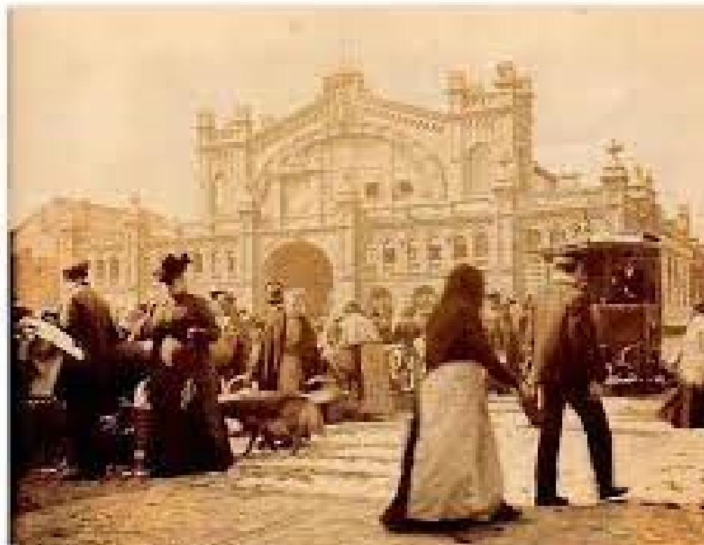
Варшава 1902 р.