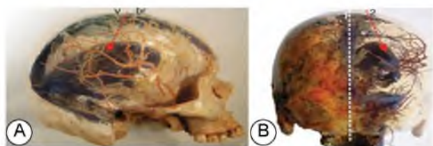
Fig. 2 – Puncture of the central part of the lateral ventricle:

A – lateral projection; B – rear projection; 1 – arrow line; 2 – the direction of the puncture needle