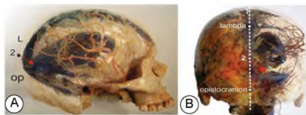
Fig. 4 – Puncture of the cerebellar-cerebral cistern: A – lateral projection; B – rear projection; 1 – arrow line; 2 – puncture site; red arrow – the direction of the puncture needle

The milling hole is applied along the middle line of the skull, taking into account the above.