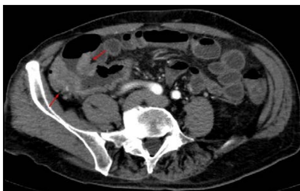
Рис. 1. При виртуальной колоноскопии инфильтративная форма опухоли слепой кишки с переходом на терминальный отдел подвздошной кишки представлена локальным неравномерным утолщением стенки до 18 мм, протяженностью около 50 мм. Отсутствует дифференциация слоев стенки кишки

Рак толстой кишки при фиброколоноскопии выявлен в 34 случаев – из них в 23 случаев толщина пораженной стенки составляла менее 10 мм, в 11 случаев более 10 мм. Как видно из таблицы 2, среди 34 случаев рака с толщиной пораженной стенки менее 10 мм при виртуальной колоноскопии рак диагностировался в 17 (73,9±9,2%), при УСГ – в 16 (69,6±9,6%) случаев, а из 11 случаев рака с толщиной пораженной стенки более 10 мм с помощью ВК в 10 (90,9±8,7%), при УСГ – в 9 (81,8±11,6%) случаев (рис. 1-2).