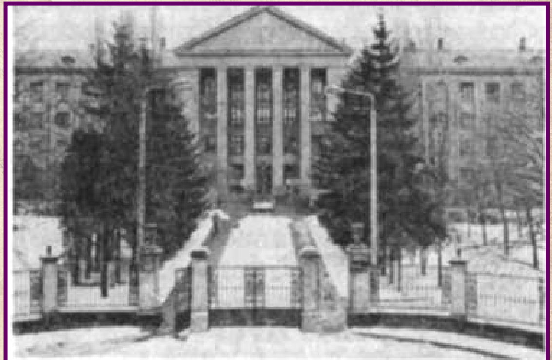
Морфологічний корпус Київського медичного інституту.