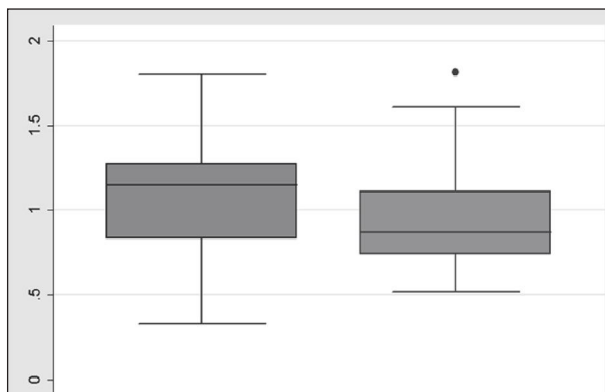
Рис. 2. Основні характеристики варіаційного ряду «пропорційний показник ранньої неонатальної смертності» (з розрахунку на 1000 народжених живими та мертвими відповідної вагової категорії) у ваговій категорії немовлят \geq 2500 г.

Аналіз плідово-малюкових втрат за методологією ініціативи ВООЗ «Кожна жінка, кожна дитина» передбачає отримання відповідей на питання: «Коли найбільше помирає новонароджених?». За даними ВООЗ 75 % неонатальних смертей відбуваються в перші 7 днів життя, тому ВООЗ і визначило пріоритетом ініціативи першу добу життя [16].