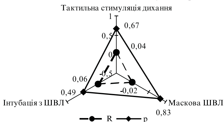
Рис. 1. Значення коефіцієнта кореляції (R) Спірмена і рівня статистичної значущості (p) характеру первинних реанімаційних заходів і факту наявності СПОН

У новонароджених зі СПОН патогенна і умовно-патогенна мікрофлора була виділена в 104 із 118 задокументованих випадків [(85,14 \pm 2,98) %], у новонароджених без СПОН – в 30