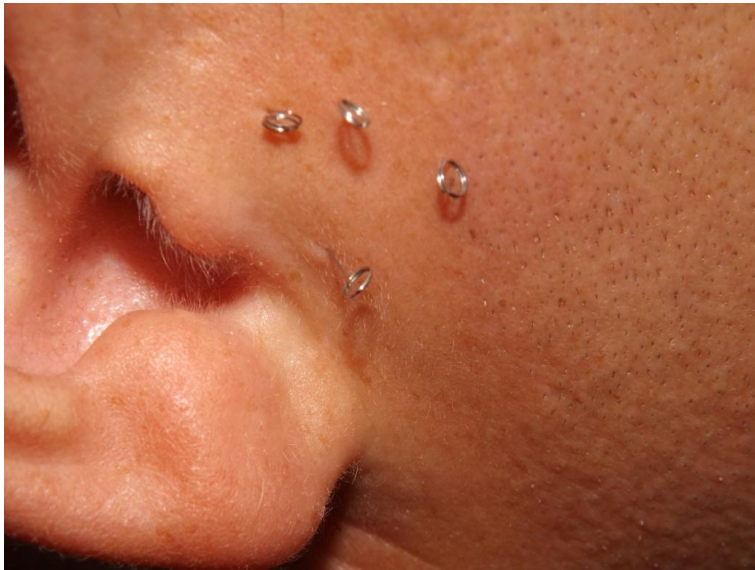
Рис.1 Проведення сеансу голкотерапії на обличчі

апарату LuxDent «UFL- 122», використання аплікатора Ляпко, методик ЦИГУН- терапії) (Рис.1, 2, 3)