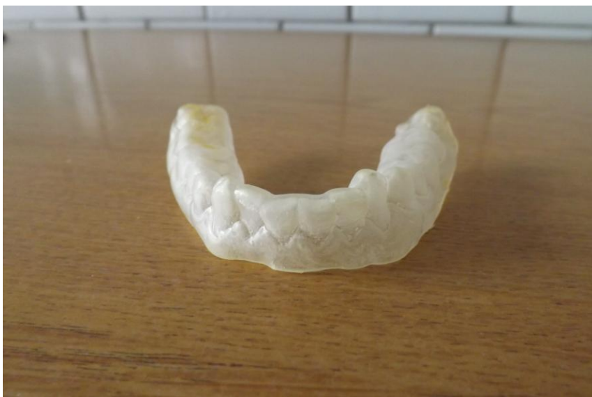
Рис.4 Суглобова капа на нижню щелепу

4. Досягнення тривалої стабілізації процесу з урахуванням виконання індивідуальної програми реабілітації складеної для даного пацієнта.