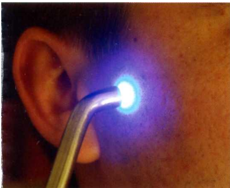
Рис.3 Світлолікування, режим В2 LuxDent «UFL 122»

шийного відділу хребта (остеопат, голкорекфлексоаналгезія, синє світло (режим В2) апарату LuxDent «UFL 122») (Рис.3).