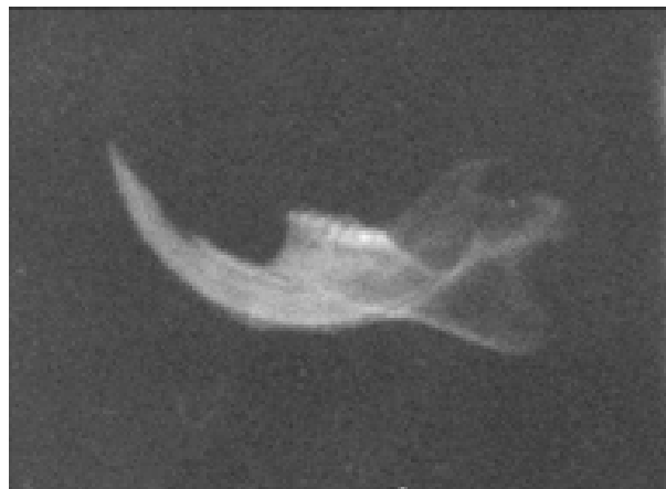
Рис. 3. Рентгенограма альвеолярного відростка нижньої щелепи інтактного щура. Зб.: 2

вміст кальцію, співвідношення кальцій/фосфор, щільність і мінеральна насиченість у порівнянні з показниками інтактних тварин (див. табл.), що свідчить про порушення процесів мінералізації в ній. При цьому вміст фосфору в досліджуваній групі суттєво не відрізнявся відносно показників інтактних тварин.