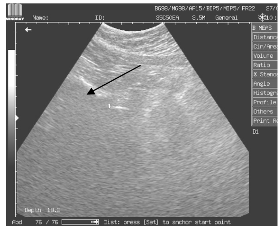
Мал.2 Антелістез L V у пацієнта з СДГМС

У пацієнтів з СДГМС нами були виявлені такі ознаки: підвищення ехогенності диска (кільця та ядра) відмічалось у 63,6% обстежених пацієнтів, що було достовірно вище, ніж аналогічний показник в контрольній групі ( p < 0,05 ); фрагментація ядра та поодинокі або множинні гіперехогенні вклучення були виявлені у 45,5% обстежених пацієнтів, що також достовірно ( p < 0,01 ) відрізнялось від показників контрольної групи, деформації позвонкового каналу у вигляді протрузій були виявлені у 36% пацієнтів ( p < 0,01 ) (Мал.1,4); виявлення остеофітів невеликих розмірів спостерігалось у 27,3% обстежених пацієнтів ( p < 0,01 ), у 15,1% обстежених на рівні L_v відмічались антелістези I ст., ( p < 0,01 ) (Мал.2), у 3% - ретролістези I ст. ( p < 0,01 ) при чому у цих пацієнтів були відсутні дегенеративні зміни у дисках у тій мірі, що зазвичай призводить до розвитку лістезів. У пацієнтів цієї групи відмічалось достовірно ( p < 0,05 ) зниження висоти міжхребцевих дисків у порівнянні із контрольною групою.