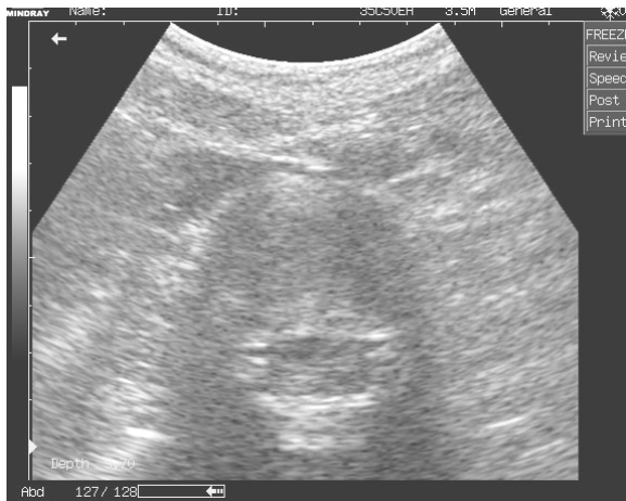
Мал.1 Лівобічна парамедіанна протрузія у пацієнта з СДГМС

У випадку відсутності нормального розподілу досліджуваних даних центральні тенденції та дисперсії досліджуваних ознак описували за допомогою медіани (Me) та інтерквартильного розмаху (25 та 75 перцентилі). Для подільшого дослідження використовували критерії Манна – Уїтні, Вальда – Вольфовїца, Колмогорова – Смірнова, для аналізу кореляції використовували методи Спірмена та Кендалла. Статистично значимими вважались відмінності на рівні p < 0,05 .