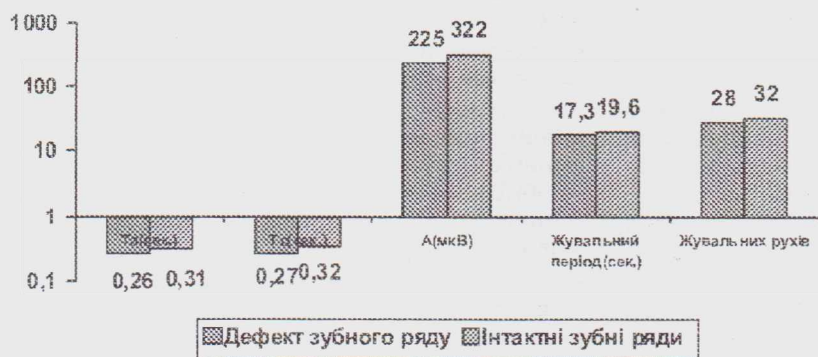
Рис. 1. ЕМГ показники функціонування власно жувальних м'язів при дефекті зубних рядів.

структури запису, тобто зміну залпів збудження з періодами відносного біоелектричного спокою. Сила збудження наростає до середини залпу ак-