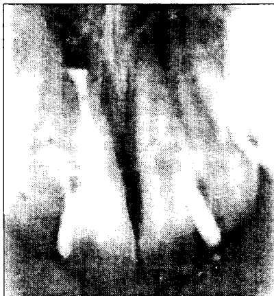
Мал. 2. Пацієнт Б., 3 місяці після реплантації. Рентгенологічна картина ділянки реплантату не відрізняється від попередньої. Лігатура відсутня.

Тимчасова зовнішня резорбція (поверхнева резорбція) не має клінічного значення та не визначається рентгенологічно у зв'язку із її малими розмірами. При ній дрібні та незначно ушкоджені ділянки кореня притягують макрофаги, які вилучають некротизовані тканини. Цим і обмежується очищення кореневої поверхні фагоцитуючими клітинами, а новий шар цементу, як передумова відновлення періодонту, формується із цементобластів прилеглого цементу та клітин сусідніх тканин, тобто репаративний