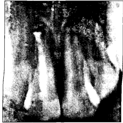
Мал. 3. Пацієнт Б. 6 місяців після реплантації. Суттєвих рентгенологічних змін в ділянці реплантату у порівнянні із попереднім терміном не визначається.

У перший післяопераційний рік рекомендується обстеження зони реплантату через 3 та 6 тижнів; 3, 6, та 12 місяців, а далі — 1 раз на рік. Оцінка пародонтальних структур проводиться за допомогою порівняльних рентгенограм.