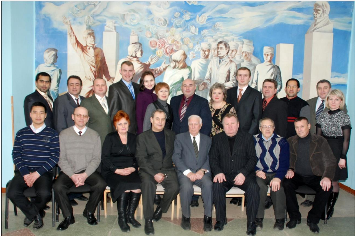
Науково-педагогічний склад кафедри (2011 рік)

дисертації. На кафедрі продовжує навчання 4 аспірантів, 2 магістра та 5 клінічних ординаторів.