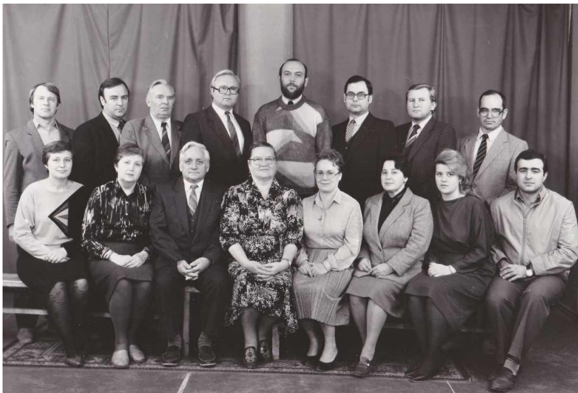
Науково-педагогічний склад кафедри (1988 рік)