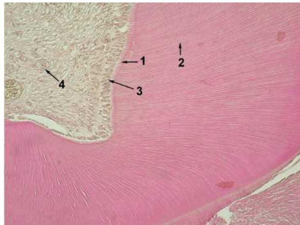
Рис. 1. Навколопульпарний дентин великого кутнього зуба чоловіка:

Результати проведених мікроскопічних досліджень декальцинованих великих кутніх зубів виявили, що структура одонтобластів та їх монопедичних відростків дещо відрізняється у чоловіків порівняно з жінками. У рогах пульпової камери в чоловіків одонтобласти мають багаторядну структуру (рис.1).