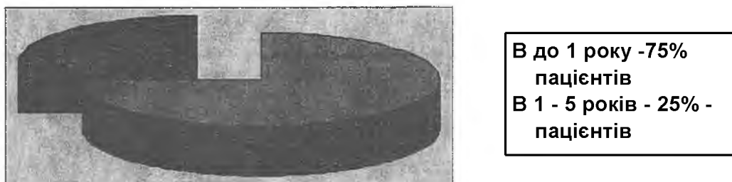
Рис. 3. Розподіл хворих з папуло-пустульозною стадією рожевих вугрів легкого ступеня перебігу відповідно тривалості захворювання.

переважали пацієнти, тривалість захворювання яких до 1 року - 75%. Пацієнтів, давність захворювання яких - від 1 до 5 років, нараховано 25% і зовсім не було пацієнтів, тривалість захворювання яких більше 5 років (рис.3).