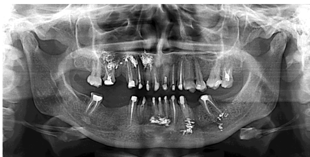
Рис. 1. На ортопантомограмі пацієнта М. наявність пломбувального матеріалу за верхівками коренів зубів 11, 12, 13, 14, 16, 31, 33, 36, 41, 42; у безпосередньому зв'язку з нижньощелепним каналом у ділянці зубів 33, 36

Зміщення пломбувального матеріалу у верхньощелепний синус було виявлено в 9 жінок у віці від 30 до 53 років.