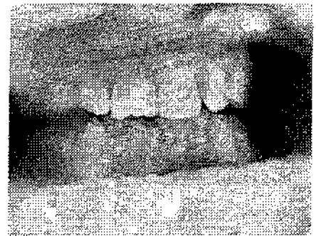
Рис.2. Загальний вигляд капи в порожнині рота

поверхнями на капі, які втратили захисне покриття, можна визначити латеротрузію, медіотрузію і наявність суперконтактів. На капі чітко відбивається малюнок суперконтактів, який можна сфотографувати і застосовувати в діагностиці та лікуванні для вибору ортопедичної конструкції і диспансерного нагляду за проведеними лікувальними заходами. Використання капи не змінює об'єм порожнини рота, що не впливає на положення язика та функціональні особливості жувальної мускулатури. Підвищені контакти чіткі й отримуються при різних оклюзійних положеннях нижньої щелепи.