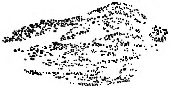
Рис. 3. Предыдущее изображение после использование команды Process>Binary>FillHoles.

На следующем этапе, с помощью команды Image>Type конвертируем активное изображение в 8-битное (в результате чего получаем изображение в оттенках серого цвета).