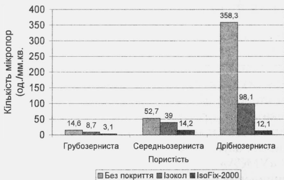
Рисунок 1. Зміна кількості мікропор при використанні різних покривних систем

Для нівелювання кількості та величини розмірів мікропористості поверхні зубоясенних запобіжників, нами був запропонований в якості компенсаційного покриття гіпсової моделі « IsoFix-2000 », який проникає у поверхню гіпсової моделі, закриває відкриті пори і не утворює шару; поверхня твердіє, згладжується і стає водовідштовхуючою.