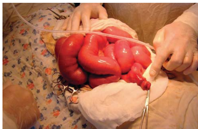
Рис. 2. Дитина Р., 13 років, стан після дезінвагнації за Гутчинсоном