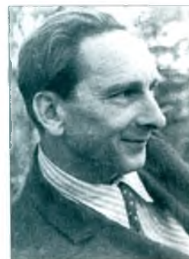
М. А. Бельговський.

ний метод одержання кофеїну та теоброміну із рослинного матеріалу. У 1950-х вперше в країні розробив метод виготовлення пластмас холодного затвердіння на основі акрилатів, які до цього часу випускаються промисловістю. У числі цих матеріалів розроблені полімери для пломбування зубів (АСТ-1, АСТ-2, АСТ-Т карбодент). Серед розробок вченого: відтисний матеріал «Альгеласт», який використовується в стоматології, хірургії та ін. галузях промисловості; інгалятор «Інгакамі»; широкий комплекс полімерних сцинтиляторів, які використовуються для індикації радіоактивного випромінювання; спосіб одержання м-феноксифенолу, який використовується в синтезі м-біс(м-феноксифенол)бензолу — ефективного термостабільного масла і високотемпературної фази в хроматографії. Одночасно з цими розробками проводилися розпочаті ще в 1940-і роботи з електрохімічних методів дослідження та аналізу полімерів. Ці роботи, починаючи з 1968, були розширені вирішенням технологічних питань з синтезу полімерів електрохімічними методами та електрохімічного нанесення полімерних покриттів. Наук. розробки Б. відзнач. 3 медалями ВДНГ.