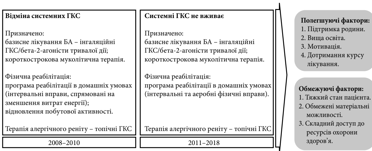
Рис. 2. Алгоритм заходів медичної реабілітації.

Перш за все було визначено основне місце проведення реабілітаційних заходів. Найбільш прийнятним виявився варіант організації реабілітації в амбулаторних умовах під наглядом лікаря-спеціаліста. Організація процесу та усі заходи медичної реабілітації були сплановані лікарем-пульмонологом з